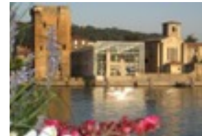
Vienne et Pays viennois, au fil du Rhône